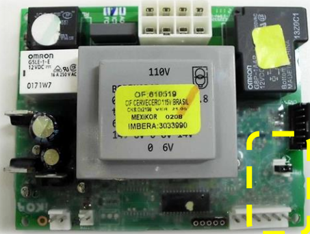
Controlador CIF - Cervejeiro